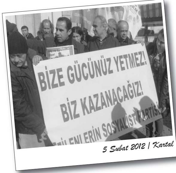
5 Şubat 2012 | Kartal

Verilen cezalar, partimizin yürüttüğü mücadeleye yönelik açık bir gözdağı ve tehdittir. Parti üye ve yöneticilerimiz hakkında verilen cezaları protesto ediyor, TMY ve ACM'lerin tüm sonuçlarıyla birlikte kaldırılmasını istiyoruz."