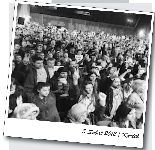
5 Şubat 2012 | Kartal